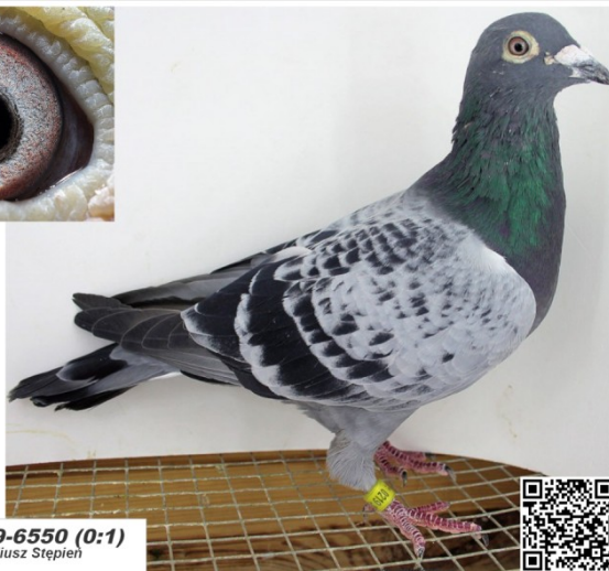
PL-0219-19-6550 (0:1)