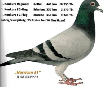
„Hurrican 51“ B 04-6338651