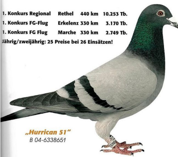
„Hurrigan 51“ B 04-6338651