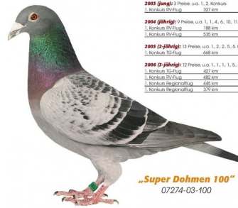
„Super Dohmen 100“ 07274-03-100