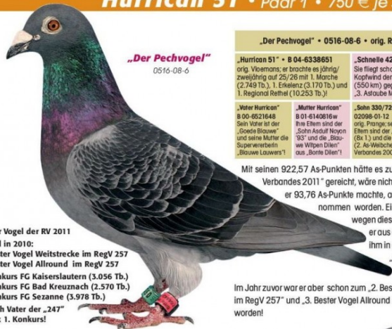
„Der Pechvogel“ 0516-08-6