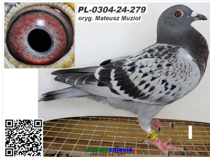
PL-0304-24-279