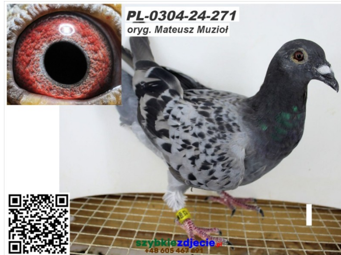
PL-0304-24-271