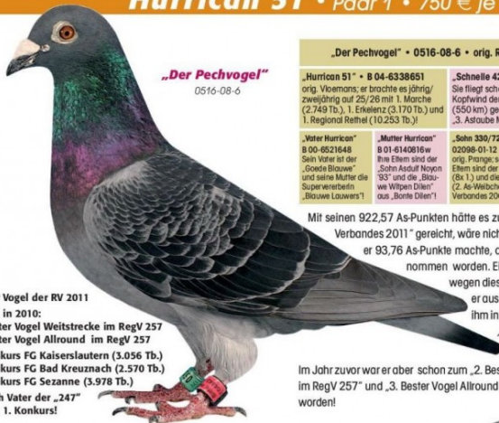
„Der Pechvogel“ 0516-08-6