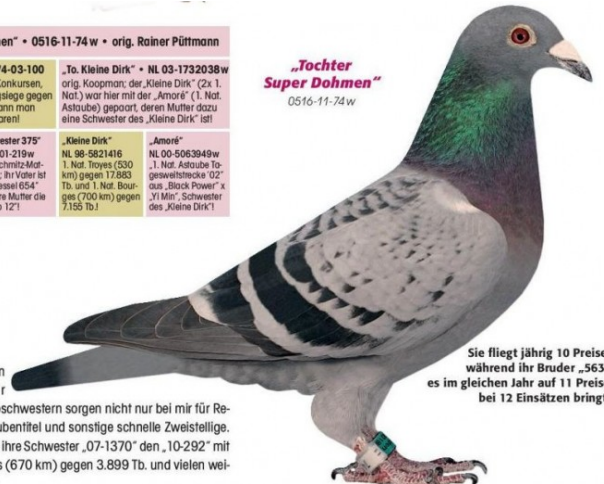
„Tochter Super Dohmen“ 0516-11-74 w

Auch ihre ungerlesten Brüder/Halbbrüder und Schwestern/Halbschwester sorgen nicht nur bei mir für Regionalfugsiege, Astaubentitel und sonstige schnelle Zweistellige. So gibt beispielsweise ihre Schwester „07-1370“ den „10-292“ mit dem 1. Regional Loris (670 km) gegen 3.899 Tb. und vielen weiteren Spitzenpreisen!