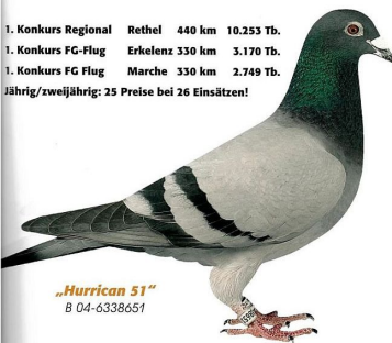
„Hurrican 51“ B 04-6338651

1. Konkurs Regional Rethel 440 km 10.253 Tb. 1. Konkurs FG-Flug Erkelenz 330 km 3.170 Tb. 1. Konkurs FG Flug Marche 330 km 2.749 Tb. Jährig/zweijährig: 25 Preise bei 26 Einsätzen!