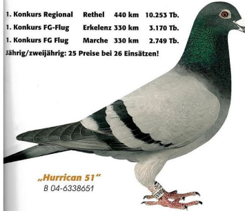
"Hurrigan 51" B 04-6338651

1. Konkurs Regional Rethel 440 km 10.253 Tb. 1. Konkurs FG-Flug Erkelenz 330 km 3.170 Tb. 1. Konkurs FG-Flug Marche 330 km 2.749 Tb. Jährlig/zweijährig: 25 Preise bei 26 Einsätzen!