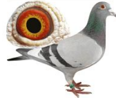
Karta własności Identity card Eigentums - Ausweis