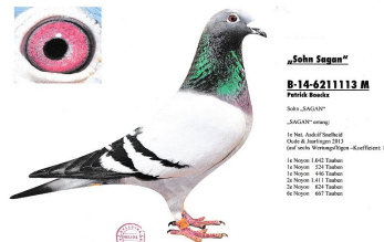
"Sehn Sagan" B-14-6211113 M PZHGP Bielsko