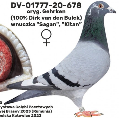
matka gołębia DV-09448-22-74, coeff. 2,50 kat. Sport F - 5 miejsce - 8. Wystawa Gołębi Poczтовых Europy Wschodniej i Środkowej Brasov 2023 (Rumunia) 2 miejsce - Wystawa Ogólnopolska Katowice 2023