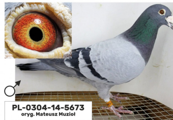
PL-0304-14-5673