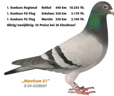
„Hurrican 51” B 04-6338651

1. Konkurs Regional Rethel 440 km 10.253 Tb. 1. Konkurs FG-Flug Erkelenz 330 km 3.170 Tb. 1. Konkurs FG Flug Marche 330 km 2.749 Tb. Jährig/zweijährig: 25 Preise bei 26 Einsätzen!