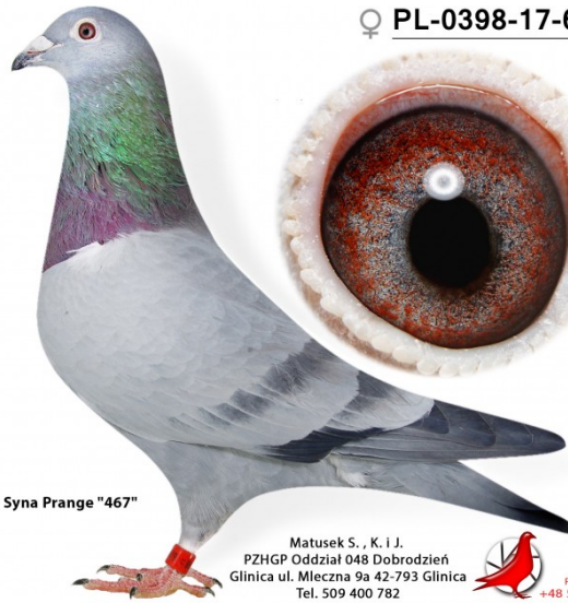
Córka "1646" Syna Prange "467"

Matusek S., K. i J. PZHGP Oddział 048 Dobrodzień Glinica ul. Mleczna 9a 42-793 Glinica Tel. 509 400 782